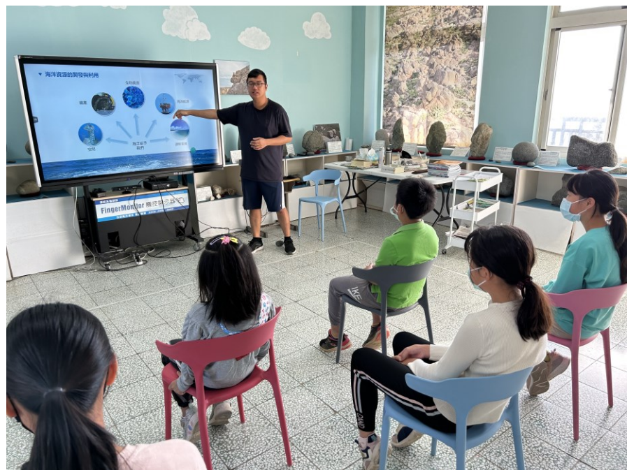
活動說明：宣導活動情形。