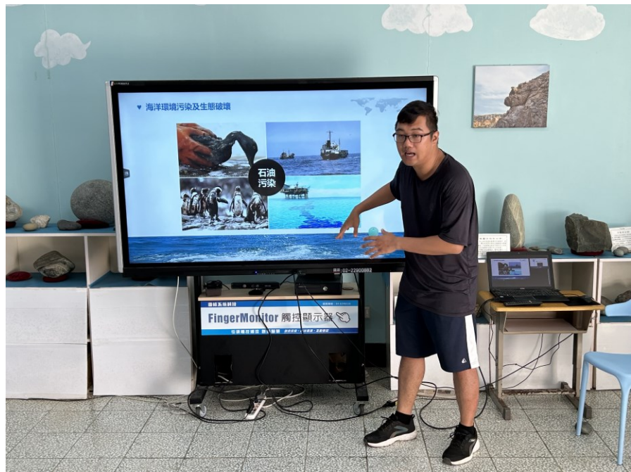
活動說明：宣導內容之一——海洋污染的影響。